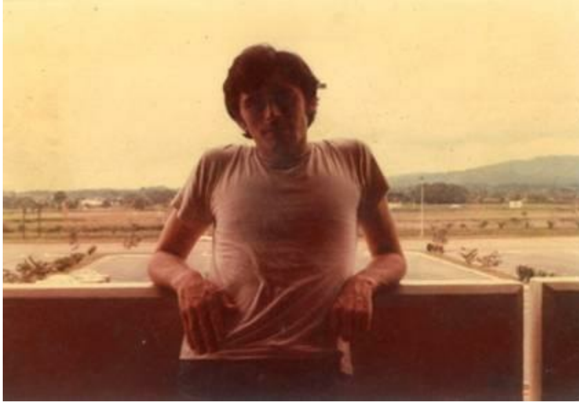
Panamá, 1979. [VB]